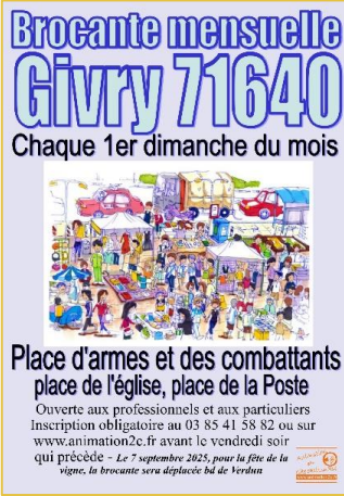
1 •• GIVRY 71