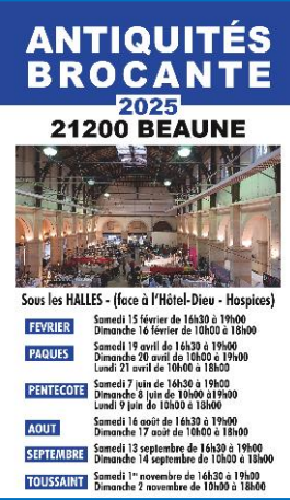
3 • BEAUNE 21