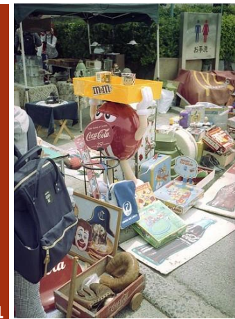
11 •••• POURLANS 71