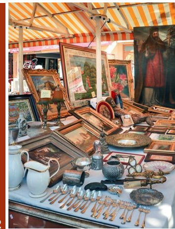
12 ••• CHAMPLAY 89